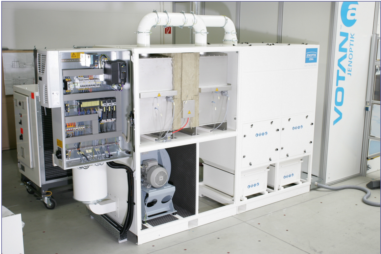
Abb. 1: Adsorptionsanlage zur Abluftreinigung mit integrierter katalytischer Nachverbrennung für 1.500 m 3 /h

Je nach Abluftsituation können die einfachen, scheinbar günstigen Anlagen durch ihren Verbrauch an Betriebsmitteln und durch Entsorgungskosten so teuer werden, dass sich im Vergleich dazu eine Anlage mit Regenerationsperipherie bereits nach einem bis zwei Jahren amortisiert hätte.