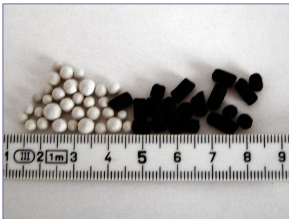
Abb. 2 Zeolith Y und Aktivkohle zur Abluftbehandlung

Neben der Verunreinigung durch Kohlestaub besteht ein Problem der selbstbefüllten Adsorptionsanlage darin, eine brauchbare Schüttung zu erzielen. Die Schüttung sollte gleichförmig und dicht sein, ein minimales Leervolumen zwischen den Körnern und insbesondere keine Kanäle oder Randgängigkeiten enthalten. Je ungleicher die Adsorbenskörner sind, je mehr ihre Form von der Kugelform abweicht, desto schwieriger ist dies ohne Einrütteln zu erzielen.